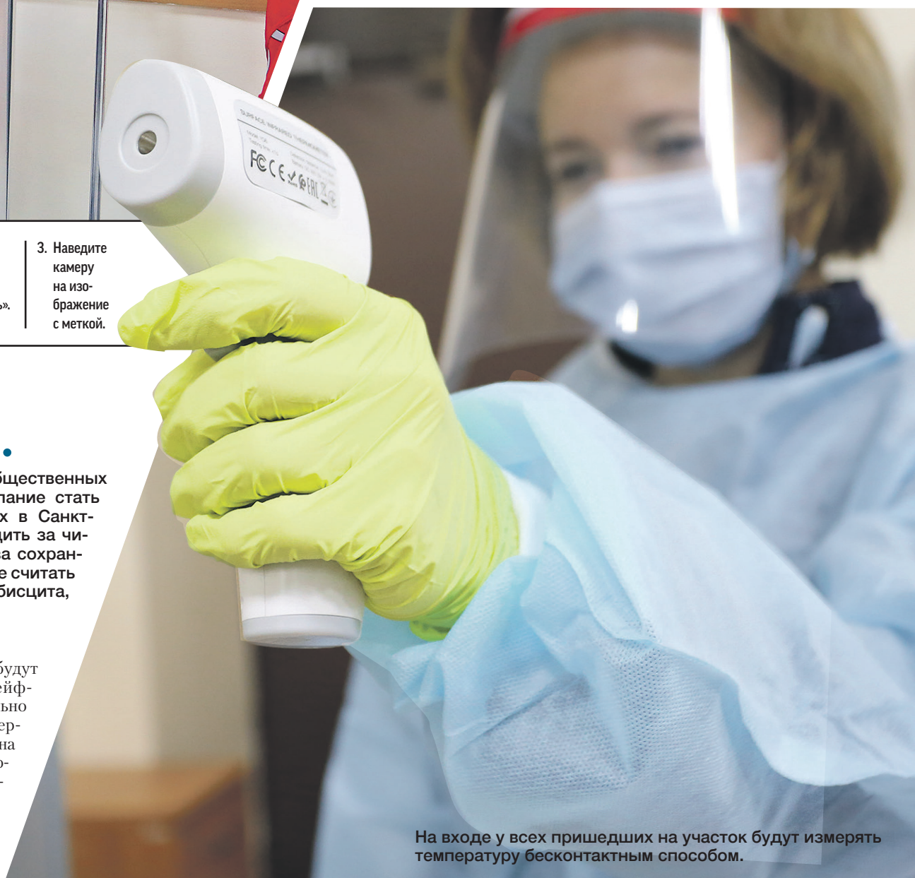
На входе у всех пришедших на участок будут измерять температуру бесконтактным способом.