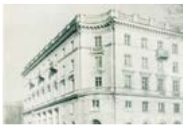
«Профессорский дом». Каменноостровский проспект, д. 25.

Расцвет творчества Олега Ивановича пришелся на 30–50-е годы прошлого века — эпоху сталинского неоклассицизма. Этот стиль, обновленный и переосмысленный, пришел на