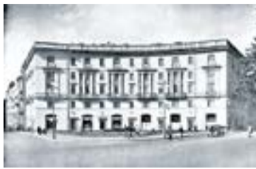
Жилой дом на Кировском проспекте, д. 2. 1950-е годы. Архитекторы: О. И. Гурьев, В. М. Фромзель. Годы постройки: 1949–1951

Архитекторы: О. И. Гурьев, В. М. Фромзель, К. А. Гербер. Годы постройки: 1951–1952