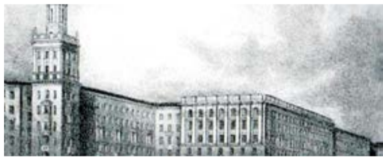
Проект жилого дома на углу улицы Ленина и Большого проспекта П. С.

Каменноостровский проспект — это одна из главных и самых красивых улиц Петроградской стороны. Он берет начало от Троицкой площади и Петропавловской крепости — того самого места, откуда начинался наш великий город. Архитектурный ансамбль исторической дороги на Каменный остров сформировался только в XX веке, но он, вобрав все лучшее от традиций петербургского зодчества, воплощает дух и красоту Санкт-Петербурга. Одним из архитекторов, который придал проспекту неповторимый облик, был Олег Иванович Гурьев.