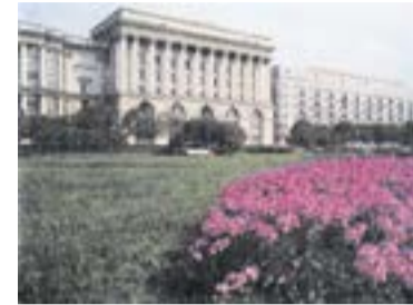
Здание ЛенНИИпроекта. 1980-е годы