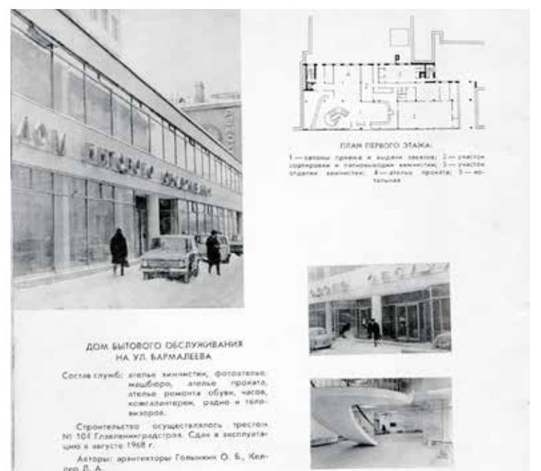
Из информационного листка Ленпроекта за 1971 год